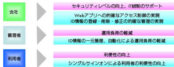
HP IceWall SSO + 結人の導入効果