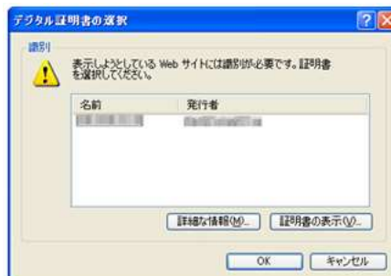
図2 電子証明書の選択画面