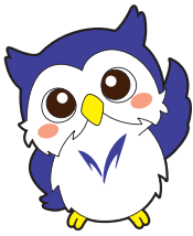
めいじろう (明治大学公式キャラクター) 明治大学の親しみやすさをイメージ しています。

“学内外の情報システムの境目はもうなくなってきています。大学間の連携による研究体制も珍しくありません。今回私たちはそういう時代に最適な認証基盤を整備することができました。これからは大学の競争力強化につながる最新技術の導入にも注力していきたいと思います”