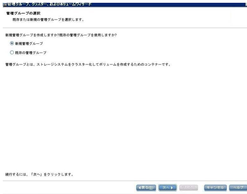
図 3. 管理グループの選択画面