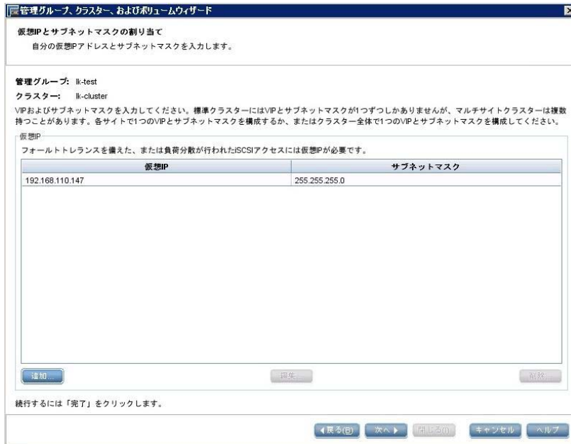
図 6. 仮想IPとサブネットマスクの割り当て画面

H) P4300 G2ストレージボリュームにアクセスするサーバー (LifeKeeperクラスターサーバーのノード1とノード2) を登録します。