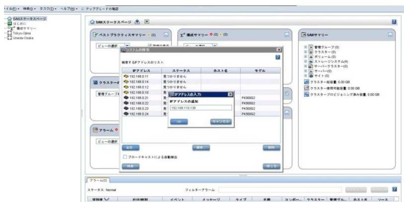
図 1. ネットワーク上のストレージシステムの検出画面