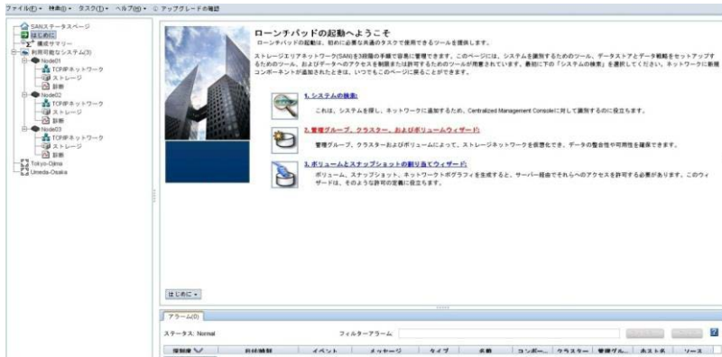
図 2. ローンチパッドの起動画面