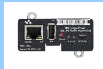
UPS ネットワーク マネージメント モジュール

本製品は、HPE 製 UPS をネットワークに直接接続し、サーバーにインストールしたクライアント ソフトウェア (HPEPP Client) と連携することでリモートから詳細な電源環境の監視や管理を包括的に制御できます。 HPENMC は UPS マネジメント モジュール (HPMM) の後継製品であり、UPS 管理用ソフトウェアが組み込まれているため、UPS 管理用のマネジメント サーバーは不要です。