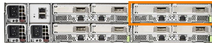
HPE Apollo 80 2Uシャーシ (背面)