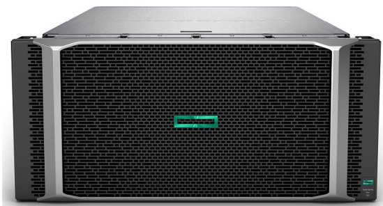
HPE Superdome Flex 280 Server 4ソケット構成正面(ベゼル付き)