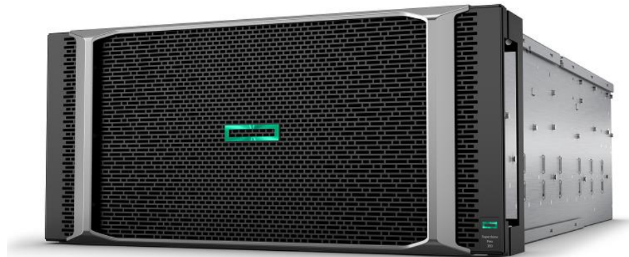
HPE Superdome Flex 280 Server for HANA