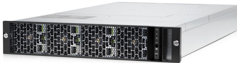
HPE Apollo 80 2Uシャーシ (前面、ベゼル付き)