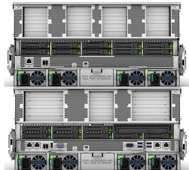
HPE Superdome Flex 280 Server 8ソケット構成背面